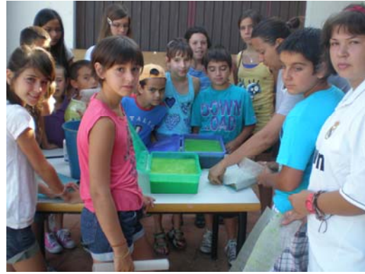
Durante el taller de papel reciclado.