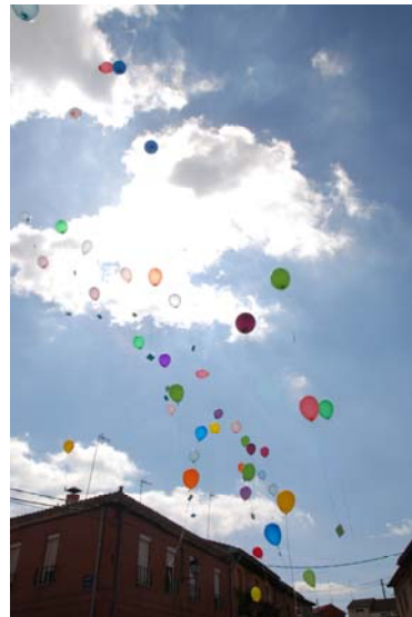
Suelta de globos con mensaje a la naturaleza.