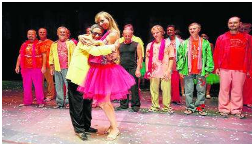
El equipo de 'L'equivoco stravagante', en la visión de Emilio Sagi, saluda al final de la representación.