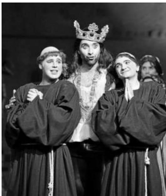
'King Arthur' de Purcell en la ópera de Montpellier.

Género inglés por excelencia, que tuvo gran predicamento en el último tercio del siglo XVII, una semiópera era una obra de teatro, habitualmente en cinco actos, que incluía escenas musicales en cada uno de ellos, especies de comentarios sobre la acción principal, pero que no tenían imbricación argumental con su trama y tampoco entre sus partes. Desplazada en las primeras décadas del siglo XVIII por la ópera italiana, en el XX se recuperó su música y,