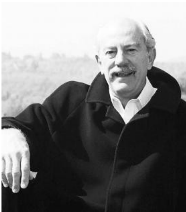
El muy 'haendeliano' director estadounidense Alan Curtis.

Director algo irregular, Curtis luce aquí a gran nivel merced al sostenido tono teatral que obtie-